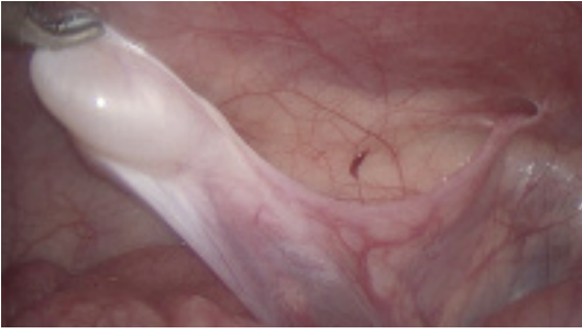
Abbildung 2: Laparoskopische Hodensuche: Der Ductus deferens führt zu einem erhaltenswürdigen Hoden.