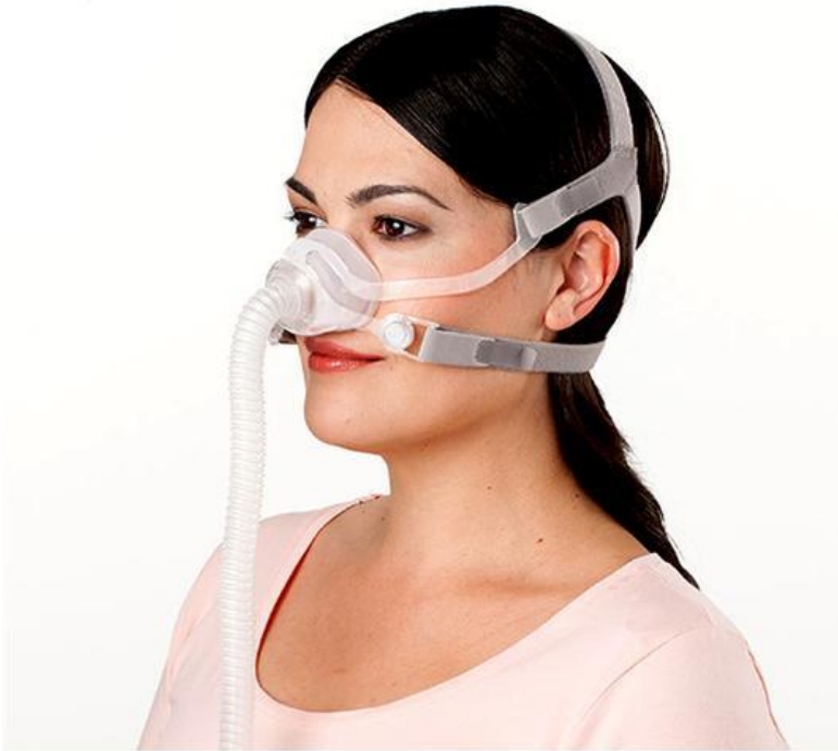
Air Fit N10 for Her, XS (nasal)