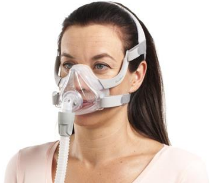
Air Fit F10 for Her, XS (full face)